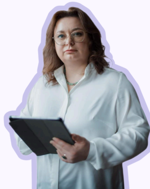
Директор Державної організації «Український національний офіс інтелектуальної власності та інновацій»

І як наслідок, така концепція навчання не лише гарантує безперервний професійний розвиток фахівців, а й стимулює розробку та впровадження результатів інтелектуальної, творчої діяльності у розбудову креативного середовища та інноваційної екосистеми як невід'ємних складових відновлення та економічного зростання України.